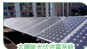
太陽能光伏供電系統