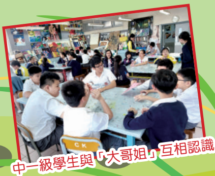
中一級學生與「大姐姐」互相認識

本校學生每年皆積極參與多項慈善活動，包括：「慈善文物行」、賣旗日等。透過參與慈善活動，讓學生學習與人相處，加深了解他人的需要，並藉此回饋社會。