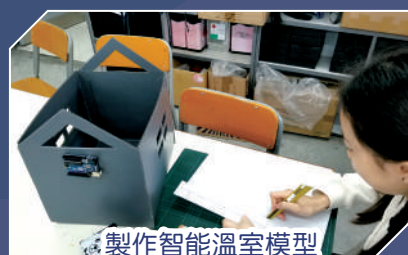
製作智能溫室模型