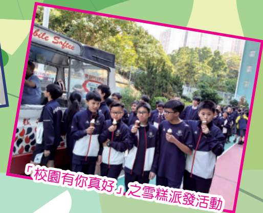
「校園有你真好」之雪糕派發活動