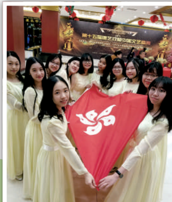
歌詠小組 CHARMING STAR 獲德藝雙馨全國總評選合唱第一名

高中攝影創作及現代創意水墨畫課程，大大豐富了視藝課堂的內容，讓學生經歷各自不同的創作過程。老師帶領學生把棄置物品轉化再造，藉著藝術的創作，將環保藝術創作落實在日常生活中。