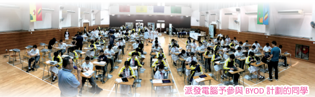
派發電腦予參與 BYOD 計劃的同學

本校亦大力發展視像教學，教師通過網絡授課，收集學生功課及進行學習評估，並採用「雲端科技」，使學習更具彈性。