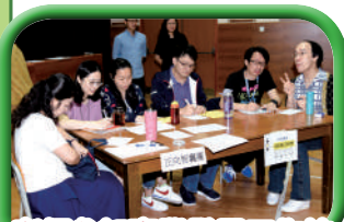
老師參加專業發展工作坊

通識教育科、經濟及企會財科，三科跨學科合辦中一級「自主學習體驗日」，學生利用 iPad 平板電腦進行分組研習。透過《多啦 A 夢》中主角大雄的角色，與及生動活潑的學習活動，讓學生認識自尊感與理財的重要性。