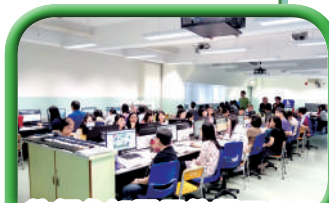
教師參加電子教學工作坊