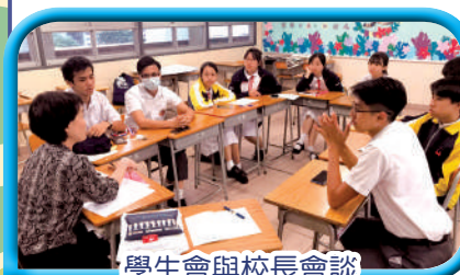
學生會與校長會談

此外，學校積極與區內教育機構及社會團體建立溝通的橋樑，加強各方面的合作，包括：在「沙田區升中博覽」及「沙田區中學巡禮」等，並每年舉辦「中一入學資訊日」，讓區內家長更詳細了解本校之辦學理念及各方面的發展。