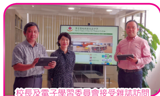
校長及電子學習委員會接受雜誌訪問