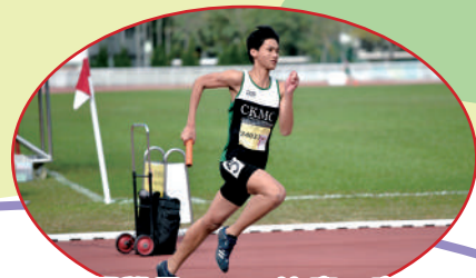
田徑學界 4X400 決賽，賽後男子乙組取得團體冠軍