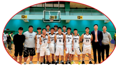
沙西區男子籃球甲組團體亞軍，並取得精英賽資格