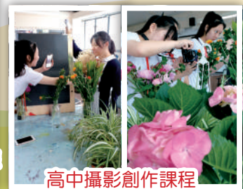
高中攝影創作課程