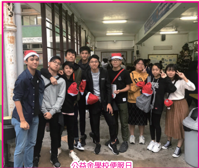
公益金學校便服日