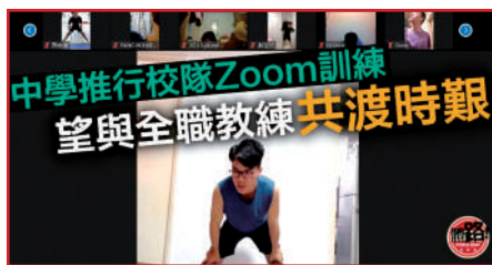
體育集誌《體路》報導網上體適能訓練

在疫症停課期間，本校積極為學生提供網上「體適能訓練課程」。有關計劃獲體育雜誌《體路》報導。報導內容可於以下 QR Code 細閱：