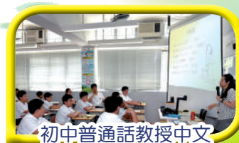
初中普通話教授中文

為了讓學生有更多機會多聽、多說普通話，本校於中一全級、中二部分班別以普通話教授中文。