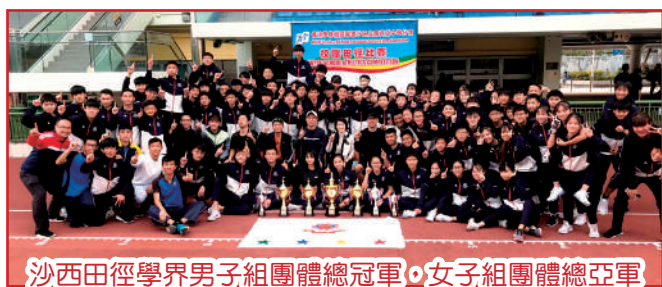
沙西田徑學界男子組團體總冠軍，女子組團體總亞軍