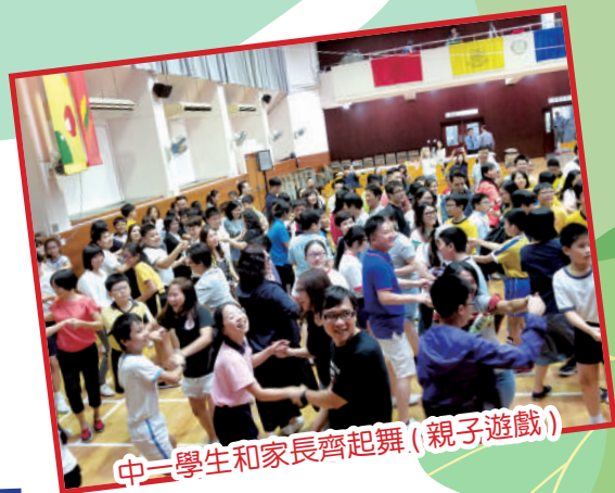
中一學生和家長齊起舞(親子遊戲)