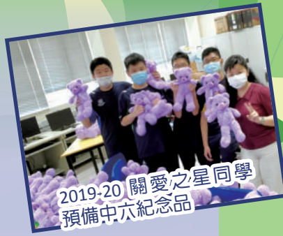
2019-20 關愛之星同學 預備中六紀念品

《校園有你真好！》活動讓師生彼此分享校園生活，加強人與人的連繫感，提升對學校的歸屬感。同時，邀請了中一及中二學生參加 Joyful Teens 同行挑戰小組，透過小組、日營及舉辦攤位分享活動，讓學生建立「正面思維」觀念，學習面對逆境的態度及方法。